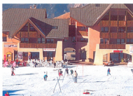
Photo prise à Valmeinier 1800 le 12/01/90. (enneigement artificiel)